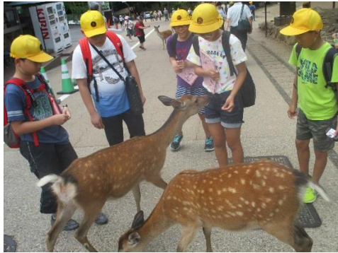
奈良公園班別研修

歴史・文化・自然・人の素晴らしさを体感し、みんなでめあてを達成した、大成功の修学旅行でした。