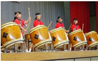
<千代保太鼓保存会の迫力ある演奏>

どの学年も持ち味を生かした工夫あふれる演奏でした。スローガンに曲を付けて発表した運営委員・司会と楽器の準備を担当した放送集会委員の動きに「自分たちで行事を成功させよう」という意気込みが感じられました。奏者と聴衆の心がひとつになった、素晴らしいえのきコンサートになりました。