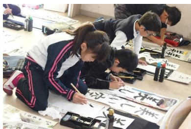
一心に筆を進める姿に感動です

1月10日(水)の2時間目に全校で書き初め大会を行いました。5・6年生は体育館で、1年生から4年生は教室で、書写の授業や冬休みに練習をしてきた成果を発揮しました。